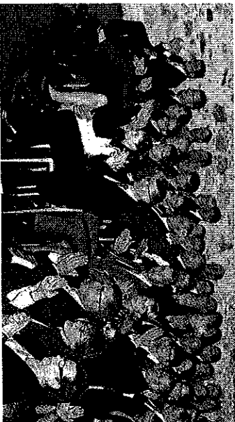
Meisterkonzertkullisse: Blick ins Publikum in der Reichstadthalle.

Er hat Sinn für das Wesenhafte auch des geigerischen Putzes, der hier nicht um seiner selbst willen aufgelegt ist.